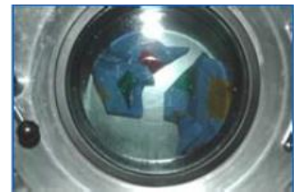
型崩れを起こさない 新たな洗浄方法

顧客情報を電子カルテ化し、顧客の生活環境に合った衣料品のメンテナンスサービスを提供するとともに、水洗いとドライの長所を併せ持つ洗浄方法の開発により、新規需要を開拓します。